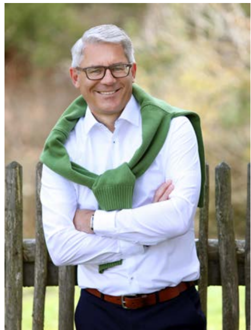
Jochen Zeller Bürgermeister